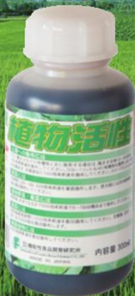
0.36kg (300ml) オープン価格