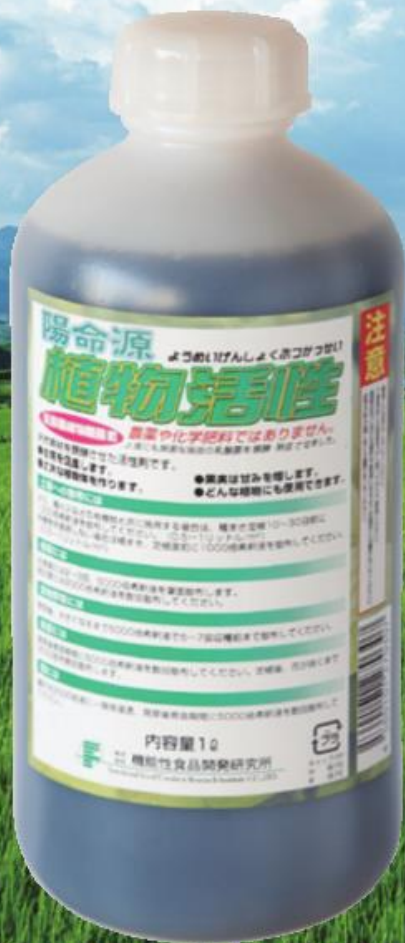
1.12kg (1L) オープン価格